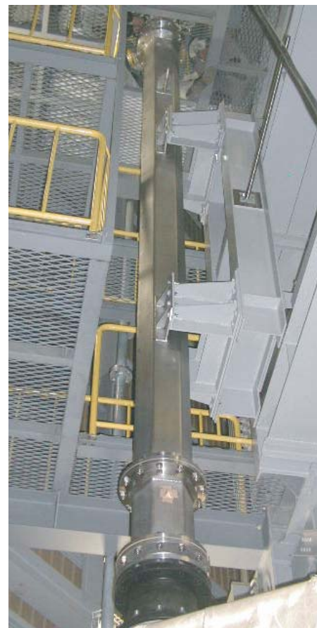
図3 実規模燃料集合体水流動実験の試験部 (燃料集合体長さ：約5m)