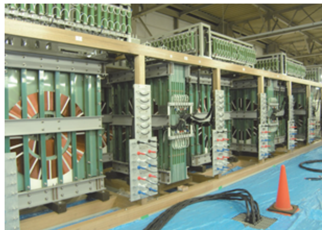
写真2 66kV送電線模擬装置