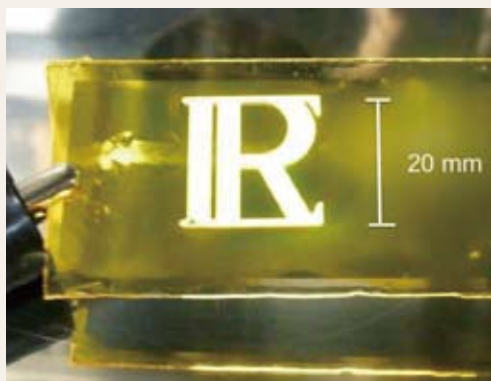
図2 イオン液体と有機発光ポリマーで構成した有機発光デバイスの試作

超音波フェーズドアレイ法により、オープンラック気化器実機下部ヘッダの伝熱細管付け根部にある疲労き裂を高精度に検出できることを明らかにした。