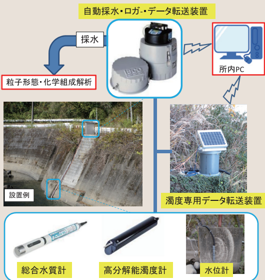
図2 河川内土砂動態観測装置の概要

西南日本の特徴的な地質構造である四十万帯の崩壊堆積物の分布する斜面を対象に、新たな評価手法を適用した結果を右側図に示す。2011年台風15号の降雨を与えた場合に浸透流解析を行った結果から得られた地盤の飽和度分布をもとに、斜面安定解析を実施した。この結果、降雨の浸透開始から時間の経過とともに局所的には安全率が低下する。しかし、全体的には安全率が1.0を上回る結果となったことから斜面が安定と評価される。